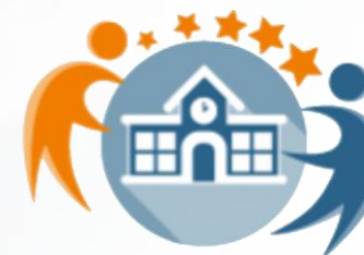
Odznaka „szkoła eTwinning”