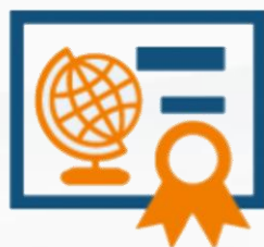
Europejska Odznaka Jakości (KOJ)