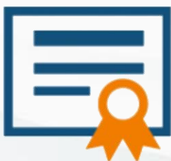
Krajowa Odznaka Jakości (KOJ)