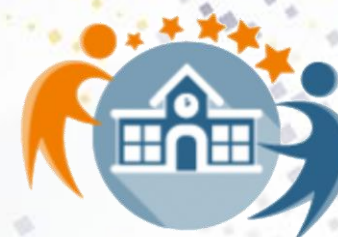
Odznaka „szkoła eTwinning”