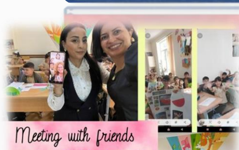
Meeting with friends