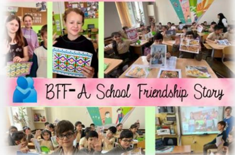
BFF - A School Friendship Story