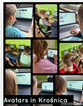
Avatars in Krośnica