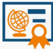
Europejska Odznaka Jakości (KOJ)