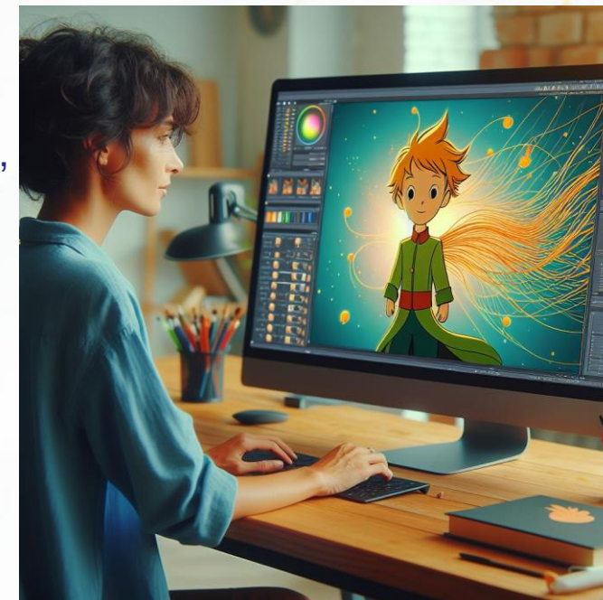
Wygenerowane przez AI

Aplikacje zawierające generatory grafiki AI, to narzędzia wspierające nauczycieli w tworzeniu efektywnych i atrakcyjnych materiałów edukacyjnych.