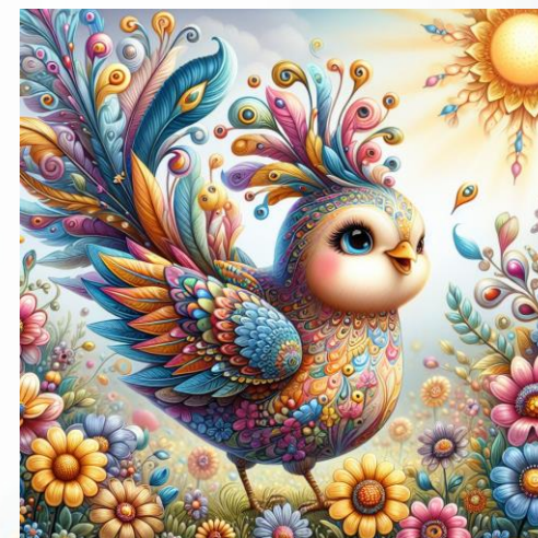
Wygenerowane przez AI