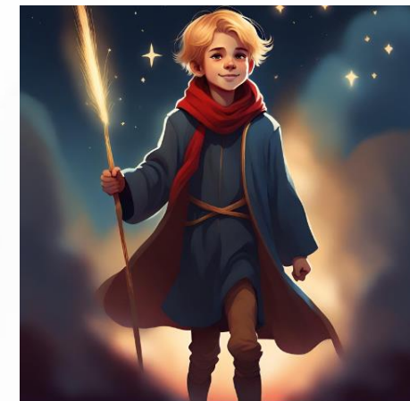
Wygenerowane przez AI

Korzystanie z aplikacji wymaga założenia konta.