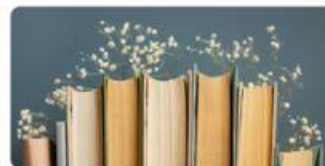
14 Cała Polska czyta na głos 2026 :: Monika Khan • 4h