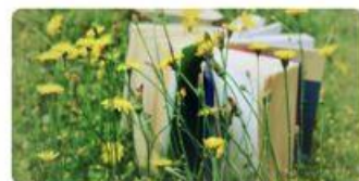
7 Cała Polska czyta na głos 2026 :: Monika Khan • 4h