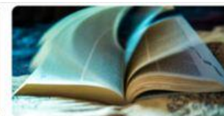
18 Cała Polska czyta na głos 2026 :: Monika Khan • 4h