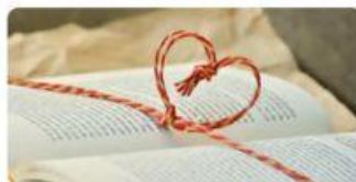
10 Cała Polska czyta na głos 2026 :: Monika Khan • 4h