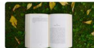
13 Cała Polska czyta na głos 2026 :: Monika Khan • 4h