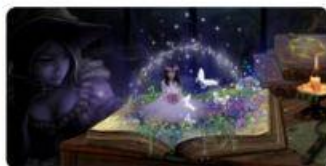
11 Cała Polska czyta na głos 2026 :: Monika Khan • 4h