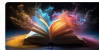
8 Cała Polska czyta na głos 2026 :: Monika Khan • 4h