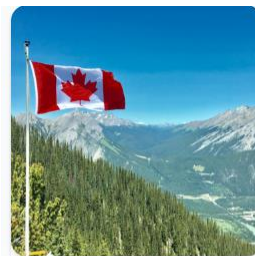
28 elementy/ów Canada's Geography