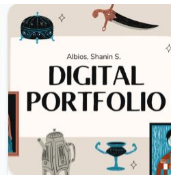
12 elementy/ów Art in the time of COVID-19