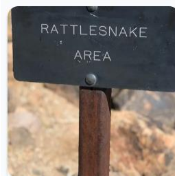
10 elementy/ów Rattlesnake Choice Board