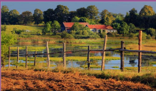
Agroturystyka na Podlasiu